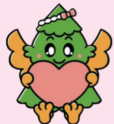
杉戸町マスコットキャラクター すぎびよん

E-mail sugito.community@machikatsu.co.jp