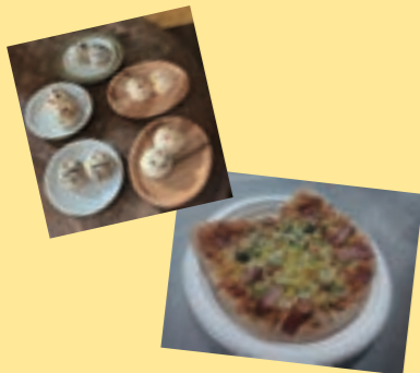
講師：内山 麻子 (楽ぱん)

大人も子どもも、多世代交流しながら、地元野菜を使ったピザを作ってみませんか。ピザ生地をキャンパスに見立て、オリジナル作品を作ります。スキマ時間に、パンに自由に絵や文字を描くパンデコモトライ♪五感をフルに使ってワクワク楽しみましょう♪