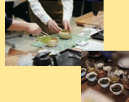
講師：十文字 由佳 (日本茶・中国茶インストラクター)